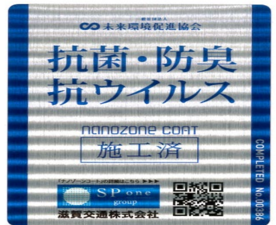
入口扉に施工済ステッカーを貼っております 2020年9月11日施工